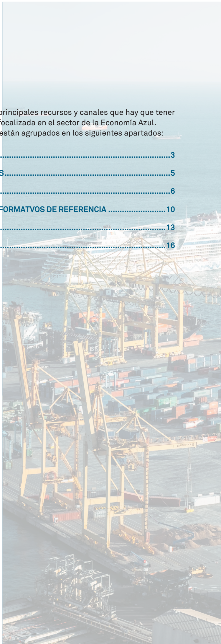
Imagen de portada Puerto de Barcelona Michael Descharles