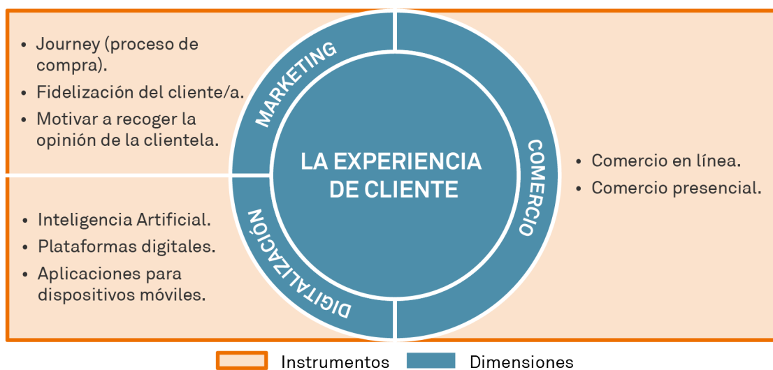
Figura 2. Dimensiones e instrumentos de la experiencia de cliente

Así, las dimensiones de la Experiencia de Cliente son las siguientes: