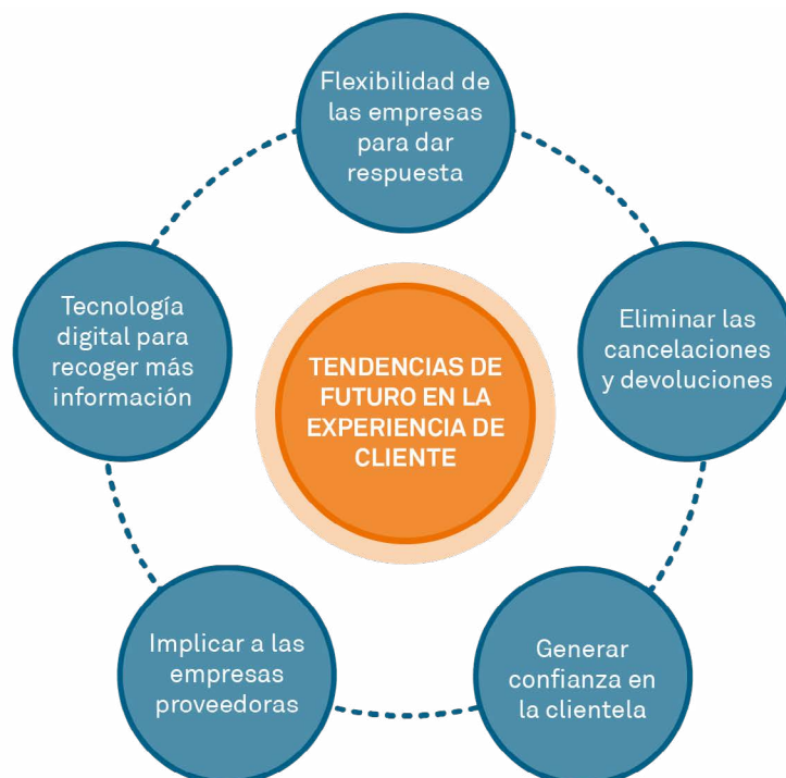
Figura 3. Tendencias de futuro en la experiencia de cliente